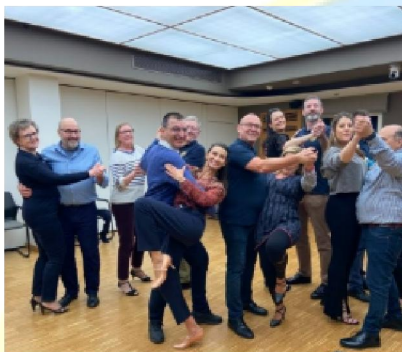
IEB podczas prywatnych lekcji tańca

Po raz pierwszy spotkałam się z niektórymi kolegami z IEB, z którymi również ściśle współpracuję. Dzięki temu doceniłam, jak ważne jest budowanie silnych relacji zawodowych, ale równie ważne jest budowanie więzi osobistych i dobrze się bawić, i właśnie to zrobiliśmy!