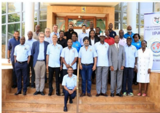
Zdjęcie grupowe wykonane na Kongresie Krajowym Sekcji IPA Kenia

Delegaci ze wszystkich ośmiu regionów w całej Kenii przybyli na czas do Lions Sightfirst Auditorium w Loresho, Nairobi. Są to wybrani przywódcy regionalni, reprezentujący swoje regiony na corocznym wydarzeniu. Na tym dorocznym spotkaniu spotykają się członkowie IPA Kenya, aby podsumować poprzedni rok i zaplanować nowy.