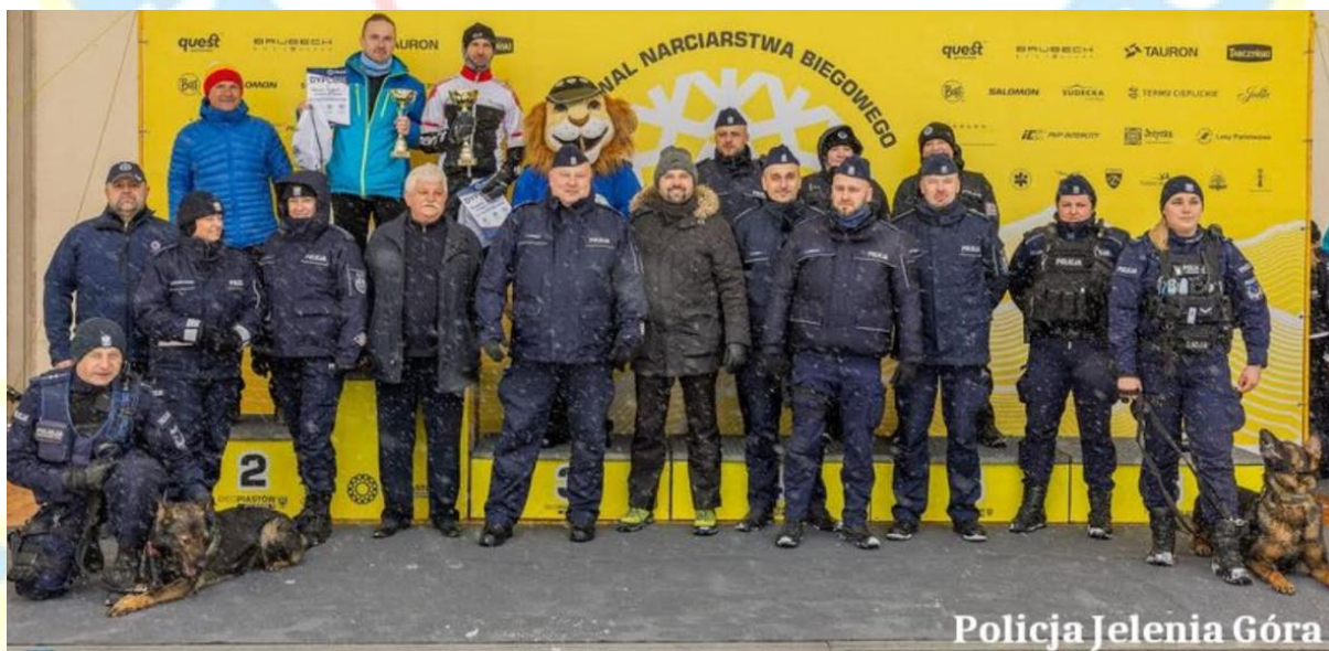
Policja Jelenia Góra