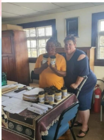
Wręczenie pucharów dla Muzeum Policji w Ventersburgu