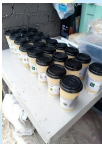
Kubki na konkursie Chilly Trench Braai