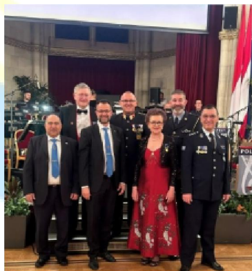
IEB na balu policyjnym w Wiedniu