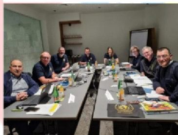
Podczas posiedzenia IEB