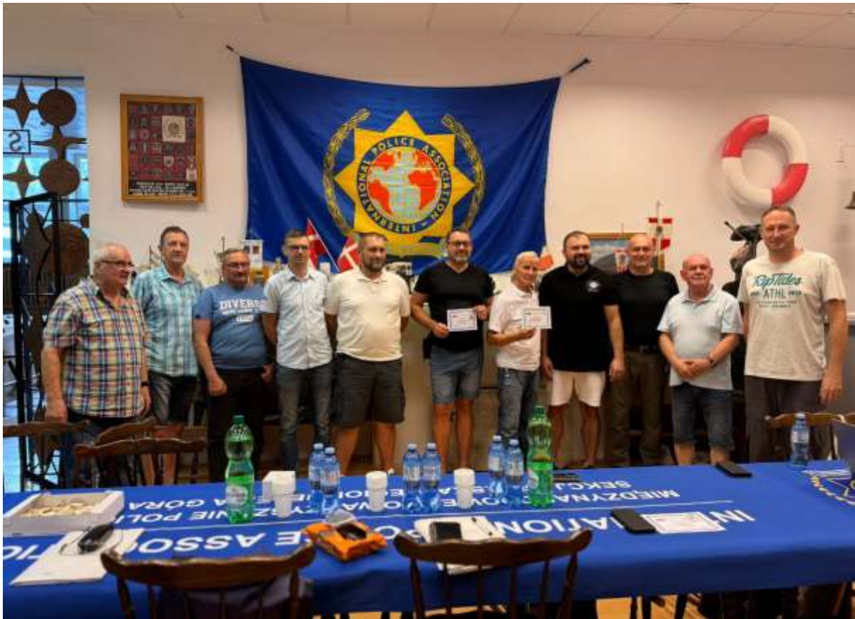
Region IPA Jelenia Góra

Przy okazji była to świetna okazja do wspomnień, wymiany doświadczeń, a także pomysłów na funkcjonowanie IPA przez kolejne dziesięciolecia.