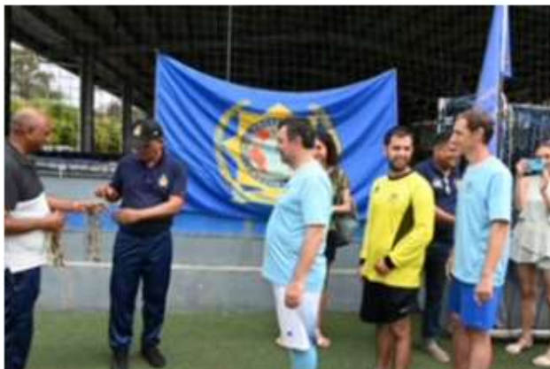
Caudan Esplanade w Port Louis.

Poza ostatecznym wynikiem, który pokazał zwycięstwo sekcji maurytyjskiej, prawdziwym zwycięzcą były wzmocnione więzi między dwiema sekcjami IPA. Zarówno gracze, jak i kibice cieszyli się z możliwości nawiązania kontaktu ze swoimi międzynarodowymi odpowiednikami, dzielenia się doświadczeniami i budowania przyjaźni ponad granicami.